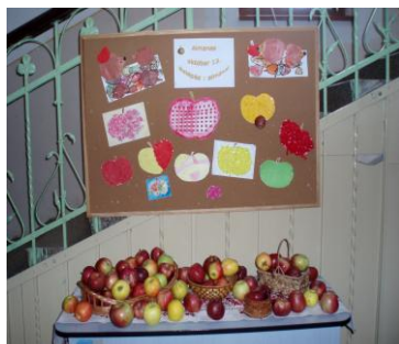
Almanap az iskolában