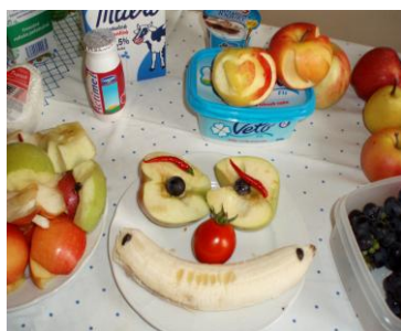
Vitamin nap a napköziben