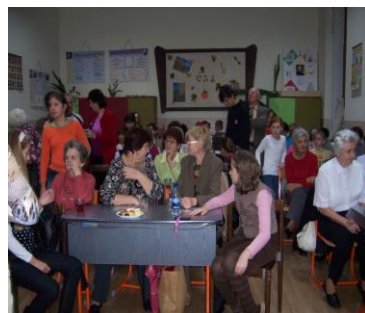
Teadélután a nagyszülőkkel